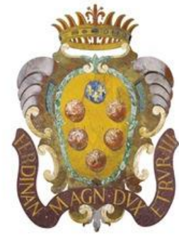
Opificio delle Pietre Dure